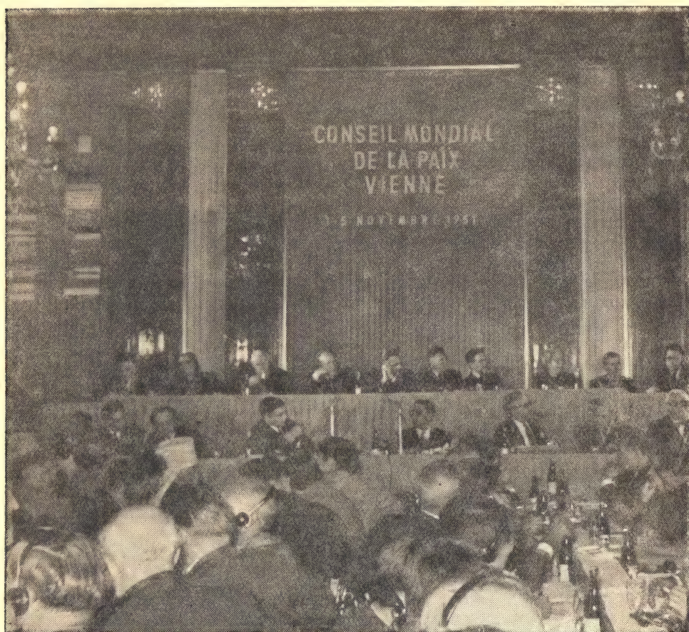
Общий вид зала заседаний Венской сессии Всемирного Совета Мира

прогрессивно настроенных учителей США, — ученик спросил: «Почему мы немедленно не сбросили атомные бомбы на Советский Союз?» Не успел я что-либо ответить, другой ученик добавил: «Ведь русские — не люди».